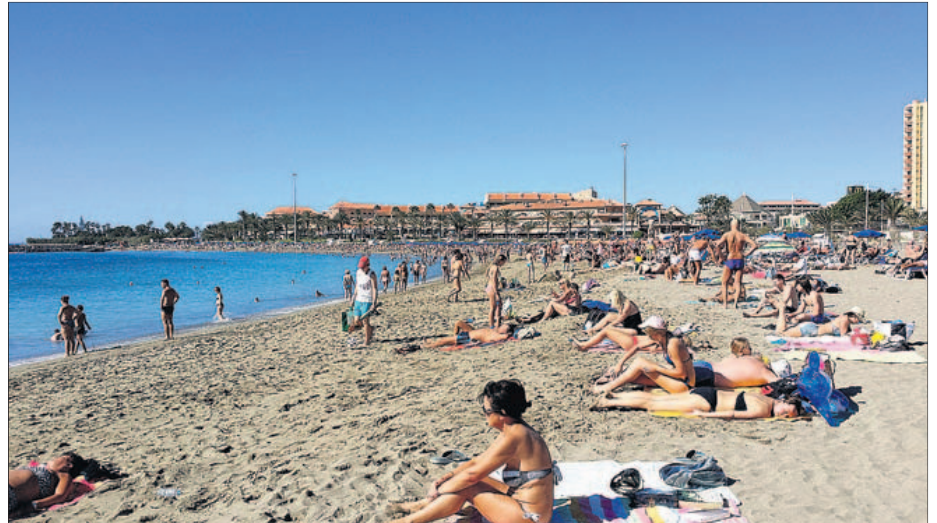
Vista de la playa de los Cristianos, al sur de Tenerife, repleta de turistas y bañistas.