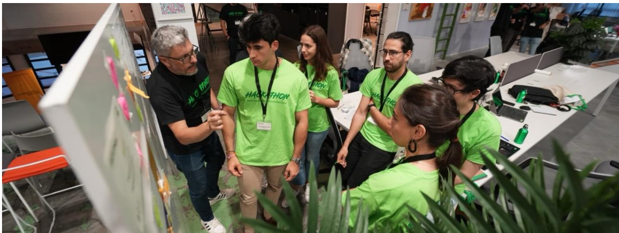
Fotografía 2. Mentor guiando al equipo a través de metodologías de innovación.

Cada organización presentará un reto que será abordado por dos equipos, quienes en tan solo 20 horas deberán idear las soluciones más creativas e innovadoras. Para ello, serán guiados a través de un proceso de innovación de la mano de un grupo de expertos en metodologías y herramientas de innovación, que les ayudarán a diseñar propuestas disruptivas y viables