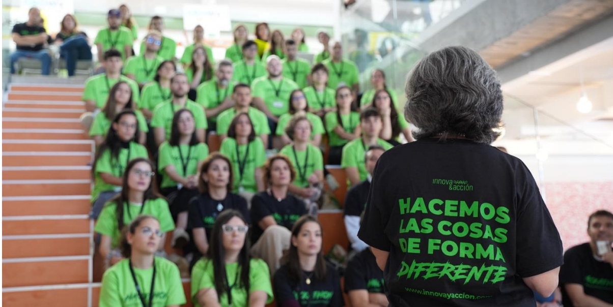
Fotografía 1. Foto del Acto de Apertura de la primera edición del Hackathon Innova&acción de Sostenibilidad.

El próximo 8 y 9 de marzo, 60 mentes creativas participarán en la II Edición del Hackathon Innova&acción de Sostenibilidad en Bilbao, un evento pionero en Innovación Abierta que resolverá retos reales de sostenibilidad presentados por organizaciones referentes a nivel nacional e internacional.