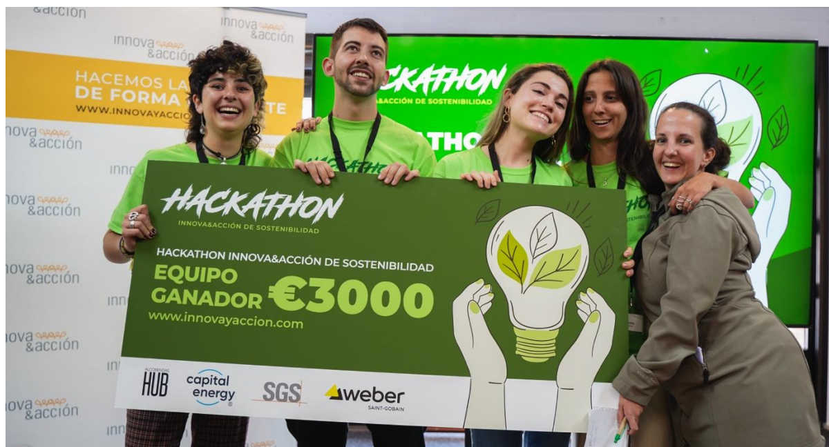
Fotografía 3. Equipo ganador de la primera edición del Hackathon Innova&acción de Sostenibilidad.

Después de estas 2 jornadas de creatividad e innovación, llenas de dinámicas, talleres y pitch para fomentar el desarrollo y la creación de cada una de las propuestas, los equipos deberán presentar su propuesta y solución ante un jurado de expertos, que serán los encargados de evaluar la viabilidad y el impacto potencial de cada proyecto, y en función de ello, seleccionar la propuesta ganadora de esta segunda edición, premiada con 3.000 euros .